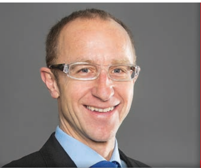
ANDREAS HAIDER Präsident des ÖFV

„Das Jahr neigt sich langsam aber sicher dem Ende zu, weshalb ich einen Blick auf 2015 werfen möchte. Der ÖFV sieht sich seit seiner Gründung 1986 als Qualitätsgemeinschaft des Franchising.